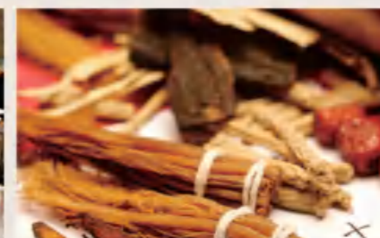
中药材 Chinese Medicinal Materials