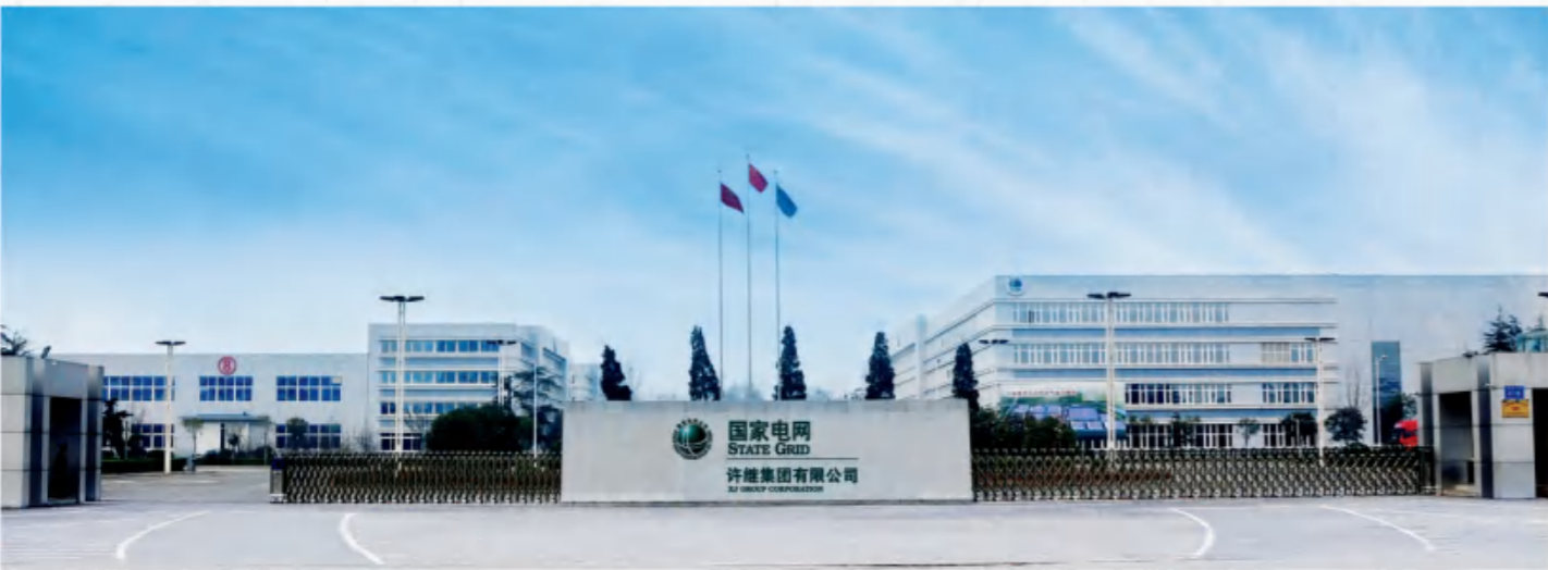
许继集团有限公司 XJ Group Corporation

biological medicine and new energy have been formed, while such industries as graphene, high-purity silicon materials and 5G are accelerating the growth. Xuchang is an important Chinese electric power equipment production base, Asia's largest synthetic diamond production base, the largest hair production base in the world, China's auto parts production base, the biggest elevator production base in central and western China, the largest renewable resources recycling base in northern China and one of three major strategic emerging industrial cluster areas in Henan Province.