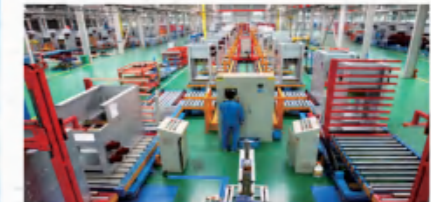
森源电气智能化生产线 Senyuan Electric Intelligent Production Line