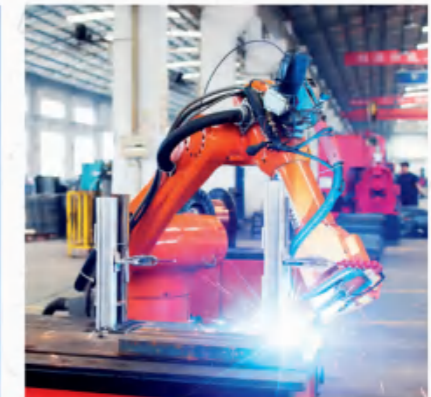
许昌美特桥架股份有限公司 Xuchang Meite Bridge Co., Ltd.