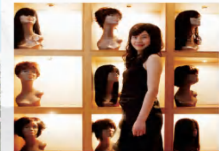
瑞贝卡发制品 Rebecca Hair Products INC.