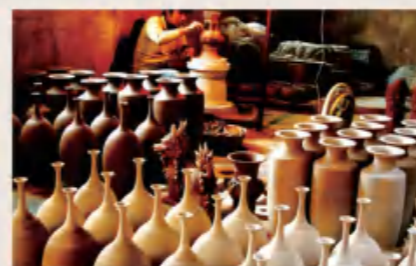
钧瓷精心手工制作 Exquisite hand-made Jun porcelain