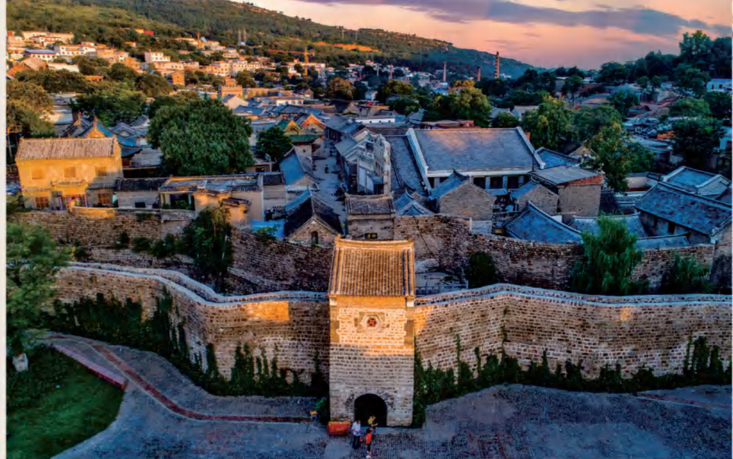
神垕古镇 Ancient Shenhou Town

国腊梅文化之乡；三为“钧都”，所辖禹州市是瓷器的重要发祥地，所产钧瓷为中国五大名瓷之一，“入窑一色、出窑万彩”，许昌被称为“钧都”，是中国陶瓷文化之乡；四为“烟都”，许昌是我国重要的烟草生产基地，是全国三大烤烟发源地之一，形成了全国最完整的烟草产业链，是中国烟草文化之乡；五为“药都”，所辖禹州市是全国四大药材集散地之一，唐代著名医学家和药学家孙思邈长期在禹州行医采药，享有“医不见药王不妙，药不经禹州不香”的赞誉。