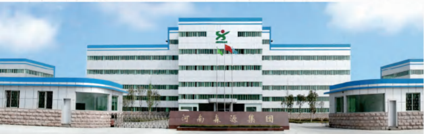
河南森源集团 Henan Senyuan Group