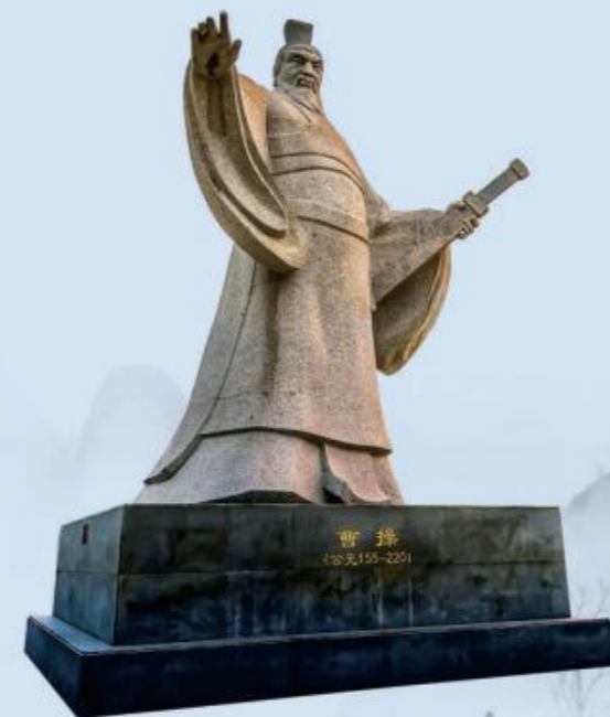
中国·许昌 Xuchang, China